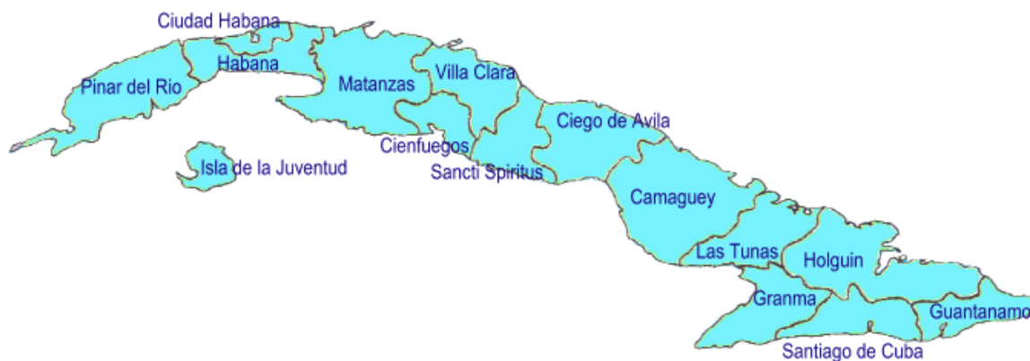
Gráfica 2: Mapa de las provincias cubanas, según la definición de 1976.

La cuestión de si la masonería cubana es predominantemente urbana o rural, puede dilucidarse comparando los (1) índices de Masones Efectivos por provincia, (2) el número de masones por logia, (3) de logias por mil habitantes, y (4) de logias por kilómetro cuadrado, entre el grupo de provincias predominantemente urbanas, y el de las predominantemente rurales. La Tabla 11 y la Gráfica 3 muestran como existe una marcada diferencia entre ambos grupos. Las provincias más urbanas muestran, en general, coeficientes de masones efectivos , de logias/mil habitantes, y de logias/Km 2 , más altos que las medias nacionales respectivas (10.4, 2.82, 2.88), y un promedio de miembros por logia, mas bajo que el nacional (92.2). Y las provincias predominantemente rurales, producen el resultado contrario. Ejemplos de tales resultados están en la Gráfica 3, sugiriendo que la masonería cubana es, en efecto, predominantemente urbana.